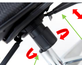
Šroub pro manuální regulaci přítlaku dle hmotnosti uživatele utažením, nebo povolením šroubu