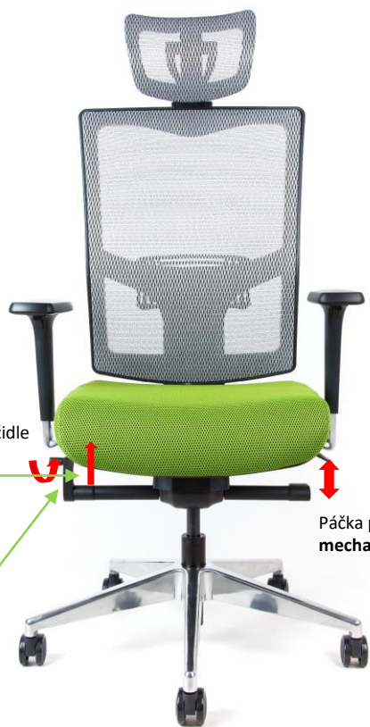
Páčka pro výškovou regulaci židle F mechanika