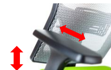
Područky B12 – výškově regulovatelné s polyuretanovou pěnou na dotykové části posuvné vpřed / vzad