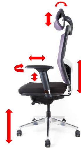
Výšková regulace židle plynovým pístem