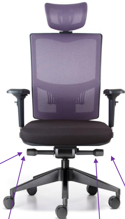
Páčka pro výškovou regulaci židle / Lever for height adjustment