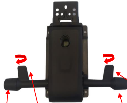
Páčka k nastavení hloubky sedáku / Lever to adjust the depth of the seat