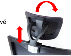
Výškově a úhlově regulovatelná opěrka hlavy