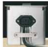
Elektrické a datové přívodní kabely