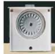
Rotační mechanismus s elektomotorem